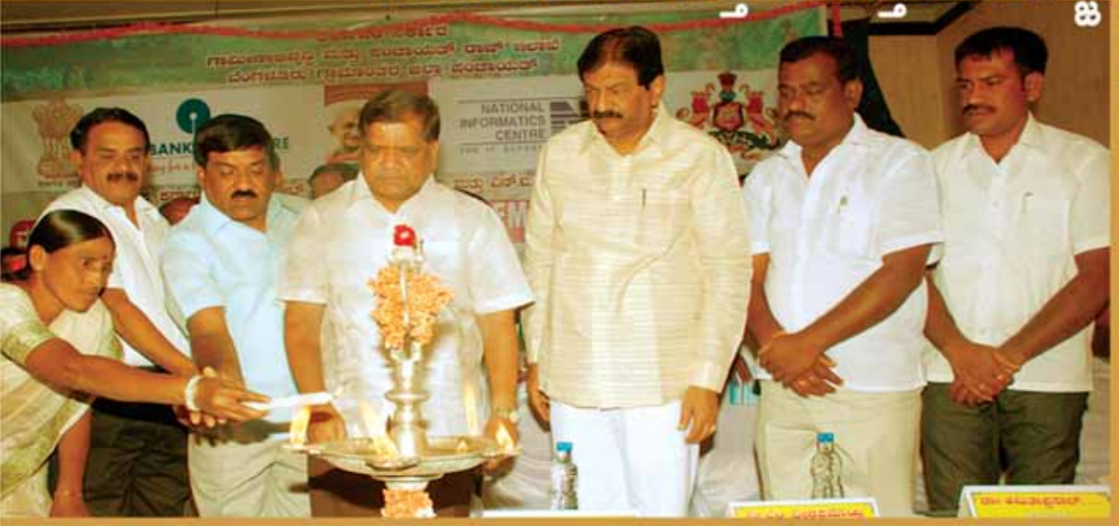
ಉದ್ಯೋಗ ಖಾತರಿ ಕೂಲಕಾರರ ಹಣ ಪಾವತಿಗೆ ನೂತನ ತಂತ್ರಾಂಶ

ಗ್ರಾ.ಪಂ.ಇಲಾಖೆ, ಎಸ್.ಜಿ.ಎಂ. ಹಾಗೂ ಎನ್.ಐ.ಸಿ ಇವರುಗಳ ಸಂಯುಕ್ತ ಆಶ್ರಯದಲ್ಲ ಎಂಜಿಎನ್‌ಆರ್‌ಇಜಿಎ ಯೋಜನೆಯಡಿ ಕೂಲಕಾರರ ಬ್ಯಾಂಕ್ ಖಾತೆಗೆ ನೇರವಾಗಿ ಹಣ ತಲುಪಿಸಲು ರೂಪಿಸಿದ ವಿದ್ಯುನ್ಮಾನ ಹಣಕಾಸು ನಿರ್ವಹಣಾ ವ್ಯವಸ್ಥೆಯನ್ನು ನೆಲಮಂಗಲದಲ್ಲಿ ಗ್ರಾಮೀಣಾಭಿವೃದ್ಧಿ ಮತ್ತು ಪಂಚಾಯತ್ ರಾಜ್ ಸಚಿವರಾದ ಜಗದೀಶ್ ಶೆಟ್ಟರ್ ಉದ್ಘಾಟಿಸಿದರು.