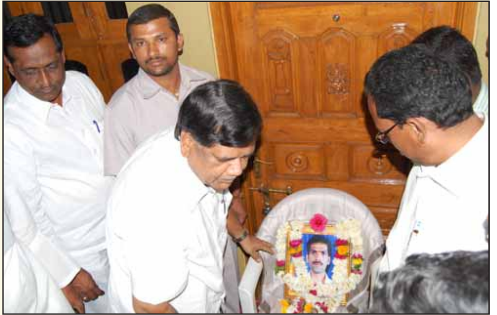
ಪಿ.ಡಿ.ಓ.ಗೆ ಶ್ರದ್ಧಾಂಜಲಿ ಅರ್ಪಿಸುತ್ತಿರುವ ಸಚಿವರು ಹಾಗೂ ಗಣ್ಯರು

ಪಂಚಾಯತ್ ರಾಜ್ ಸಂಸ್ಥೆ ಒಂದು ಬೃಹತ್ ಸಂಸ್ಥೆಯಾಗಿದ್ದು, ಇದರಡಿ ನಮಾಜದ ಕಟ್ಟ ಕಡೆಯ ಅವಶ್ಯಕತೆ ಇರುವ ಸಾಮಾನ್ಯ ಜನರಿಗೆ ಈ ಸಂಸ್ಥೆಯ ಮೂಲಕ ಅವನ ಆರ್ಥಿಕ, ಸಾಮಾಜಿಕ ಅಭಿವೃದ್ಧಿ ಸಾಧಿಸಲು ಮತ್ತು ಆತನು ಸಬಲತೆ ಹೊಂದಿ ಒಂದು ಹಂತಕ್ಕೆ ಬರಲು ಸಹಾಯ ಕಲ್ಪಿಸುವ ಮಹತ್ ಉದ್ದೇಶ ಇಟ್ಟುಕೊಂಡಿದೆ.