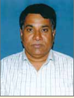
ಡಾ. ಎಂ.ಜಿ. ಬಸವರಾಜ *

ಗಾಂಧಿ ಆರ್ಥಿಕ ವಿಚಾರಧಾರೆಯ ಅಧಿಕೃತ ಉತ್ತರಾಧೀಕಾರಿ ಎಂಬ ಮನ್ನಣೆಗೆ ಪಾತ್ರರಾಗಿದ್ದ ಜೋಸೆಫ್ ಕಾರ್ನಿಲಿಯಸ್ ಕುಮಾರಪ್ಪನವರು ಲೆಕ್ಕಶಾಸ್ತ್ರ ಮತ್ತು ಅರ್ಥಶಾಸ್ತ್ರಗಳನ್ನು ಬ್ರಿಟನ್ ಮತ್ತು ಅಮೆರಿಕಾ ಸಂಯುಕ್ತ ಸಂಸ್ಥಾನಗಳಲ್ಲಿ ಓದಿ ಮುಂಬೈನಲ್ಲಿ ಚಾರ್ಟೆಡ್ ಅಕೌಂಟೆಂಟ್ ಆಗಿ ಕೆಲಸ ಮಾಡುತ್ತಿದ್ದ ಇವರು ತಮಿಳುನಾಡಿನ ತಂಜಾವೂರಿನಲ್ಲಿ 1892 ಜನವರಿ 4 ರಂದು ಎಸ್.ಡಿ.ಕಾರ್ನಿಲಿಯಸ್ ಮತ್ತು ಎಸ್ಸರ್ ರಾಜನಾಯಕಮ್ ದಂಪತಿಗಳ ಒಂಭತ್ತನೆಯ ಮಗನಾಗಿ ಜನಿಸಿದರು. ತಂದೆ ಅಲ್ಲಿನ ಲೋಕೋಪಯೋಗಿ ಇಲಾಖೆಯಲ್ಲಿ ಕೆಲಸದಲ್ಲಿದ್ದರು. ಗಾಂಧೀಜಿ ಕಲ್ಪನೆಯ ಸರ್ವೋದಯ ಆರ್ಥಿಕ ವಿಚಾರಧಾರೆಯ ಸೆಳೆತಕ್ಕೆ ಒಳಗಾದ ಕುಮಾರಪ್ಪನವರು ಹೇರಳವಾಗಿ ವರಮಾನ ತಂದು ಕೊಡುತ್ತಿದ್ದ ಸ್ವಂತ ಉದ್ಯೋಗಕ್ಕೆ ಬಿಟ್ಟು 1924ರಲ್ಲಿ ಸಾಬರಮತಿ ಆಶ್ರಮದಲ್ಲಿ ಗಾಂಧೀಜಿಯವರೊಡನೆ ಸೇರಿ ಬಿಟ್ಟರು. ಗಾಂಧೀಜಿಯವರ ರಚನಾತ್ಮಕ ಕೆಲಸ ಕಾರ್ಯಗಳಿಗೆ ತಮ್ಮನ್ನು ಅರ್ಪಿಸಿಕೊಂಡರು. ಅಲ್ಲಿ ಕುಮಾರಪ್ಪನವರು ಬರೆಯುತ್ತಿದ್ದ ಗ್ರಾಮೀಣ ಅಭಿವೃದ್ಧಿಯ ವಿಚಾರಗಳ ಬಗ್ಗೆ ಗಾಂಧೀಜಿಯವರಿಗೆ ಸಹಮತವಿತ್ತು. ಕುಮಾರಪ್ಪನವರ ಬಾಹುಗಳು ಗಾಂಧೀಜಿಯವರ ಆರ್ಥಿಕ ವಿಚಾರಗಳಿಗೆ ಸ್ಪಷ್ಟ ಸ್ವರೂಪ ನೀಡಿದವು.