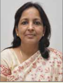
ಡಾ. ಅಮಿತಾ ಪ್ರಸಾದ್, ಭಾ.ಆ.ಸೇ. ಸರ್ಕಾರದ ಪ್ರಧಾನ ಕಾರ್ಯದರ್ಶಿ

ಗ್ರಾಮೀಣಾಭಿವೃದ್ಧಿ ಮತ್ತು ಪಂಚಾಯತ್ ರಾಜ್ ಇಲಾಖೆ ಮೂರನೆ ಮಹಡಿ - 'ಸಿ' ಬ್ಲಾಕ್ ಬಹುಮಹಡಿ ಕಟ್ಟಡ, ಬೆಂಗಳೂರು - 560 001.