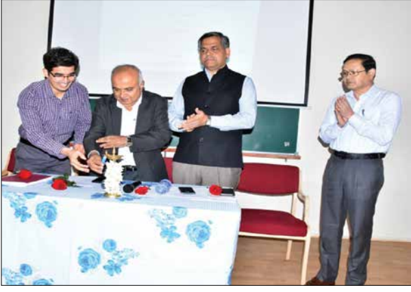
ಇಂಗ್ಲೀಷ್ ಸಂಹವನ ಕೌಶಲ್ಯ ತರಬೇತಿ ಕಾರ್ಯಕ್ರಮದ ಉದ್ಘಾಟನೆ.

ಪ್ರಸ್ತುತ ಜಗತ್ತಿನಲ್ಲಿ ಆಂಗ್ಲ ಭಾಷೆಯು ಅತೀ ಅವಶ್ಯಕವಾಗಿದ್ದು, ದಿನನಿತ್ಯ ಇಂಗ್ಲೀಷ್ ಮತ್ತು ಕನ್ನಡ ದಿನಪತ್ರಿಕೆಗಳನ್ನು ಹಾಗೂ ಉತ್ತಮ ಪುಸ್ತಕಗಳನ್ನು ಓದುವುದರಿಂದ ಶಬ್ದ ಭಂಡಾರ ಹೆಚ್ಚಿಸಿಕೊಳ್ಳಬಹುದು. ಆಂಗ್ಲ ಭಾಷೆಯಲ್ಲಿನ ಪರಿಣತಿಯು ವಿದ್ಯಾರ್ಥಿಗಳಲ್ಲಿ ಆತ್ಮವಿಶ್ವಾಸವನ್ನು ಮೂಡಿಸುವುದರೊಂದಿಗೆ ಉದ್ಯೋಗ ಸಂದರ್ಶನಗಳನ್ನು ಯಶಸ್ವಿಯಾಗಿ ಎದುರಿಸುವಲ್ಲಿ ಹಾಗೂ ಜಾಗತಿಕ ಮಟ್ಟದಲ್ಲಿ ವ್ಯಾಪಾರ-ವ್ಯವಹಾರ ನಿರ್ವಹಣೆಯಲ್ಲಿ ಮಹತ್ವದ ಪಾತ್ರವನ್ನು ವಹಿಸುತ್ತವೆ, ಕಠಿಣ ಪರಿಶ್ರಮದಿಂದ