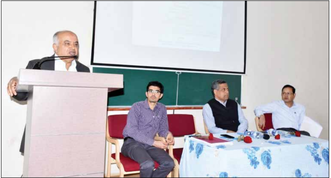
ವಿದ್ಯಾರ್ಥಿಗಳನ್ನು ಉದ್ದೇಶಿಸಿ ಮಾತನಾಡುತ್ತಿರುವ ವಿಶ್ವವಿದ್ಯಾಲಯದ ಮಾನ್ಯ ಕುಲಪತಿಗಳು.